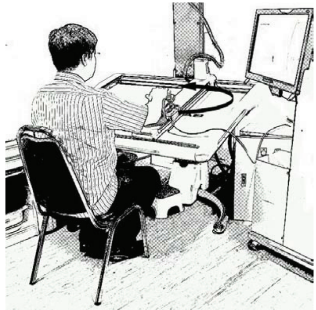
รูปที่ 1 เครื่อง SensibleTAB และท่าทางการทดสอบ โดยลูกศรสีดำในภาพแสดงตัวอย่างการเคลื่อนไหวเอื้อมมือขวาทวนเข็มนาฬิกาซึ่งกำหนดไว้ว่าเป็นการเคลื่อนไหวแบบวนออกจากตัว (reaching away)

เพื่อให้สามารถนำค่าเฉลี่ยของพื้นที่การเอื้อมมือที่วัดจากการทดสอบของผู้ป่วยที่มีอาการอ่อนแรงครึ่งซีกขวาและซ้ายมาวิเคราะห์ร่วมกันได้ ผู้วิจัยจึงได้กำหนดการเคลื่อนไหวตามการขยับมือออกจากแนวแกนลำตัวคือการวนออกจากตัว (reaching away) และการเคลื่อนไหวมือเข้าหาแนวแกนลำตัวคือวนเข้าหาตัว (reaching towards) แทนการใช้การเคลื่อนไหววนตามเข็มนาฬิกาและทวนเข็มนาฬิกา โดยที่ผู้ป่วยอ่อนแรงครึ่งซีกขวาเมื่อเคลื่อนไหวแขนขวาทวนเข็มนาฬิกาคือการวนออกจากตัว (รูปที่ 1) ส่วนการเคลื่อนไหวตามเข็มนาฬิกาคือการวนเข้าหาตัว